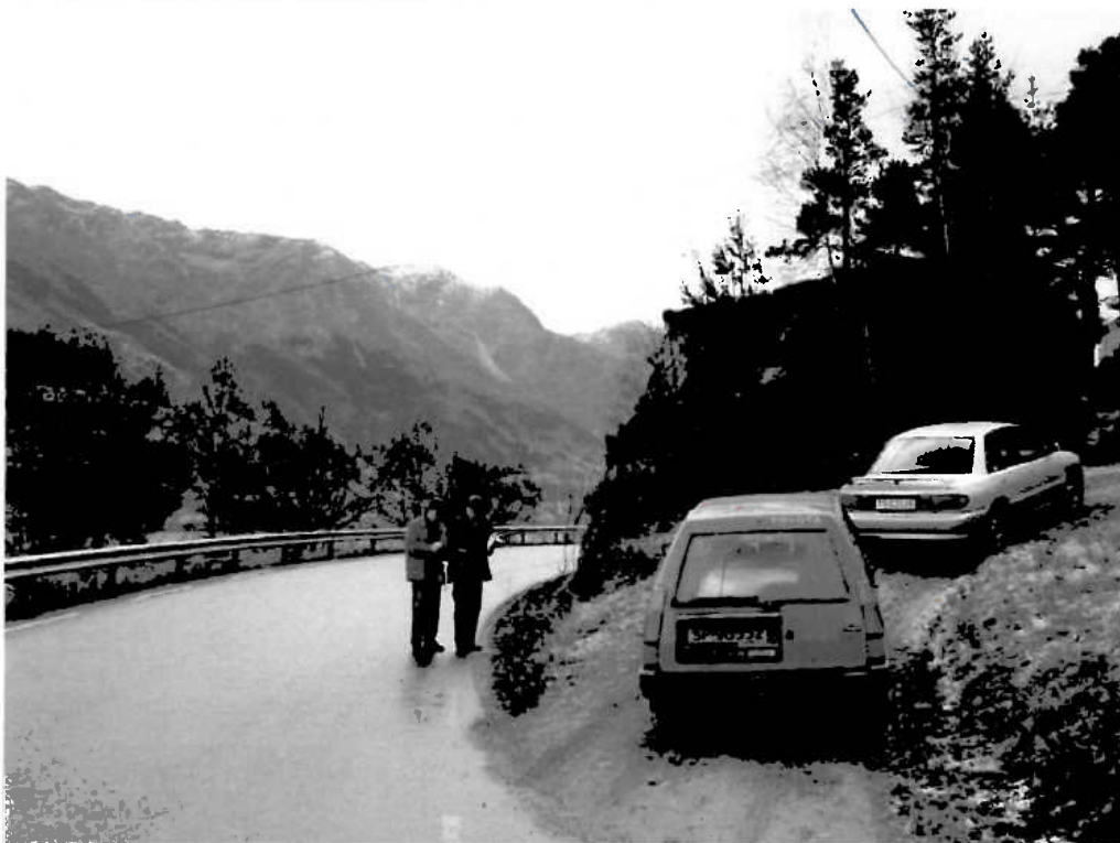
Avkjørsle ved rv. 550.

Søknad om avkjørsle vert handsama etter veglova §§ 40 - 43.