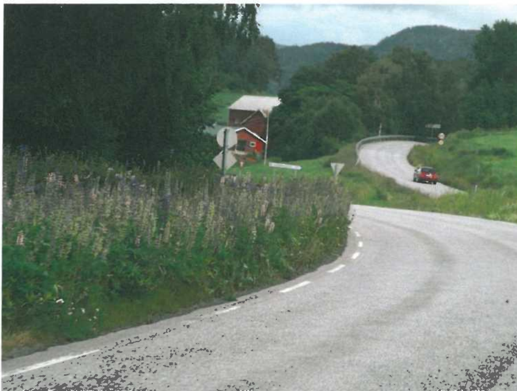
E39 langs Vinjefjorden.

"Langs offentleg veg skal det vere byggjegrænser fastsette med heimel i denne lova, dersom ikkje anna følgjer av arealdel av kommuneplan eller reguleringsplan etter plan- og bygningsloven. Byggjegrænsene skal ta vare på dei krava som ein må ha til vegsystemet og til trafikken og til miljøet på eigedom som grenser opp til vegen og medverke til å ta vare på miljøomsyn og andre samfunnsomsyn.