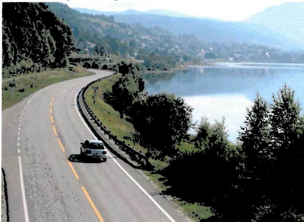
E16 mot Vossevangen.

Sett frå kommunane si side vil det kunne vere ein fordel at den enkelte kan busette seg i sitt opphavlege nærmiljø. Dette vil kunne ha positive konsekvensar for det sosiale miljøet og vil mellom anna kunne føre til redusert behov for kommunal service ved helse- og sosialsektoren. Kommunane bør difor kome med ei vurdering av korleis avkøyrslene og plassering av bygningar vil verke inn på arealdisponeringa og befolkningsutvikling i dei ulike delane av kommunen.