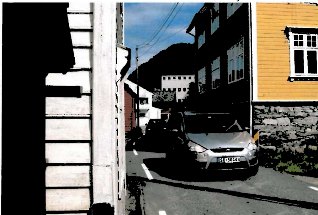
Rv. 48 Ytre Tysse.

Regionvegkontoret tar avgjerd etter denne paragrafen for riksvegar og fylkesvegar og kommunen tar slik avgjerd for kommunale vegar."