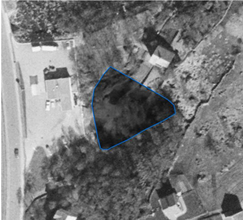
Figur 7: Flyfoto fra 1967, med planområde markert.

Det neste nære kulturminnet (id 23938), ca 50 m NØ for planområdet, er en gravrøys, 0.5 m høy, som skal ha blitt fjernet ca 1955.