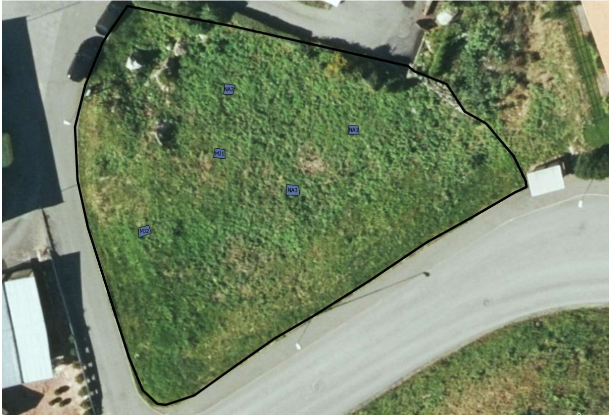
Figur 11: Satelittbilde med planområde og prøvestikk markert