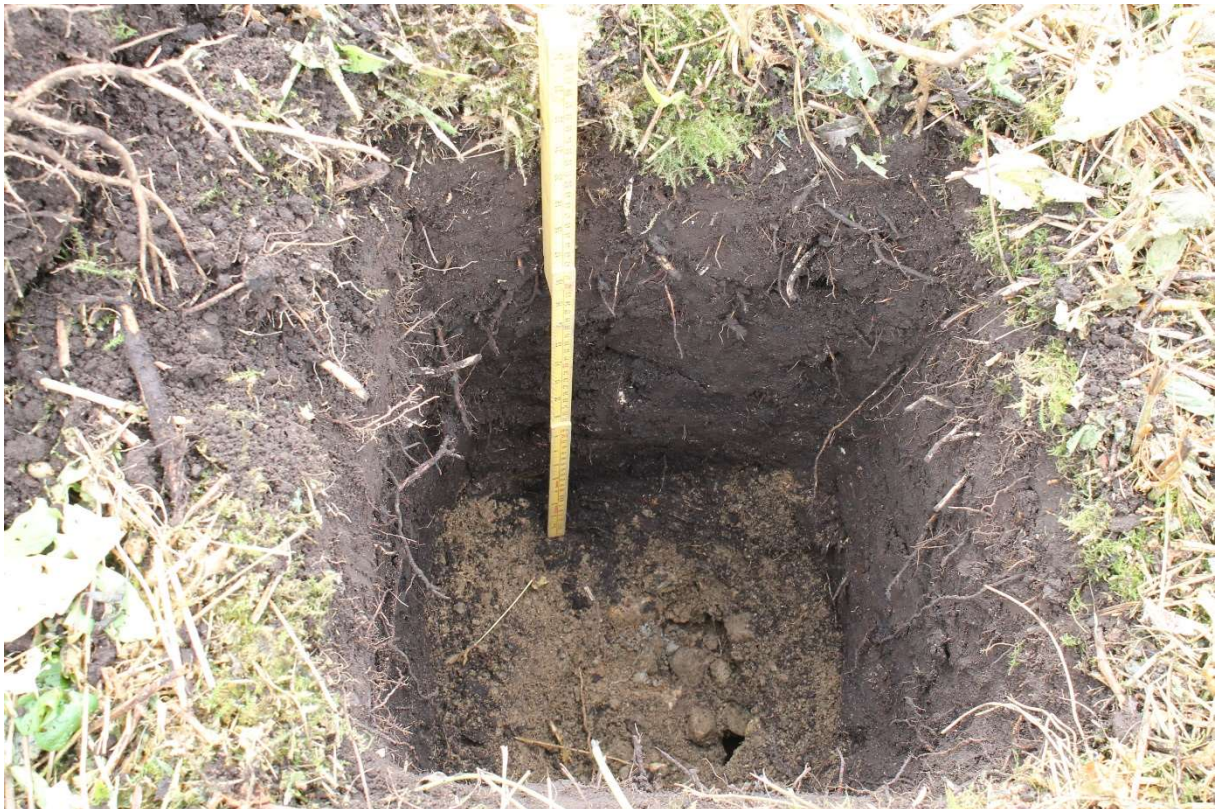
Figur 12: PSNA1, som viser lys brun påført masse under matjorda.