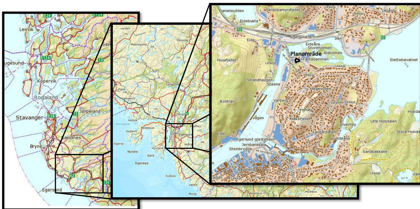
Figur 6: Kart over Rogaland, Eigersund kommune og Egersund sentrum med planområdet markert. Skala henholdsvis 1 : 2 000 000, 1 : 400 000 og 1 : 20 000

Planområdet ligger like nord for Egersund sentrum, mellom sentrum og jernbanestasjonen. Den ligger lengst nordvest på Hafsøy, som er en øy mellom to elveløp (Eideåna i nord og Lundeåna i sør) som renner vestover fra Slettebøvatnet ned til Vågen. Planområdet utgjør en avrundet trekant mellom Kjerjanesvegen i sørøst, en navnløs veg mot Kjerjaneset i vest, og eiendommen rundt et privathus i nordøst (se Figur 7).