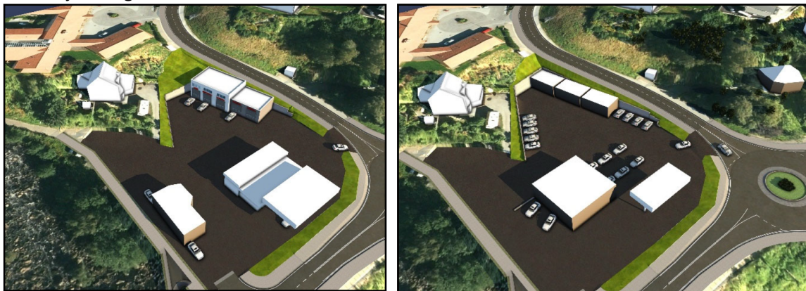
Illustrasjon 1 og 2

Illustrasjon 3 viser en situasjon hvor man legger til rette for et frittliggende bevertningsbygg. En slik situasjon forutsetter at dagens pumpestasjon tas bort, slik at byggets gis en fornuftig plassering som ivaretar krav til parkering, manøvrering samt adkomst til naboeiendommen. Bygningsmassen som er illustrert her har et samlet bebygd areal på ca. 411 m 2 med en gesimshøyde på 8,15 meter.