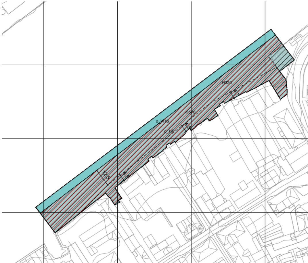
Figur 3 Forslag til reguleringsplankart