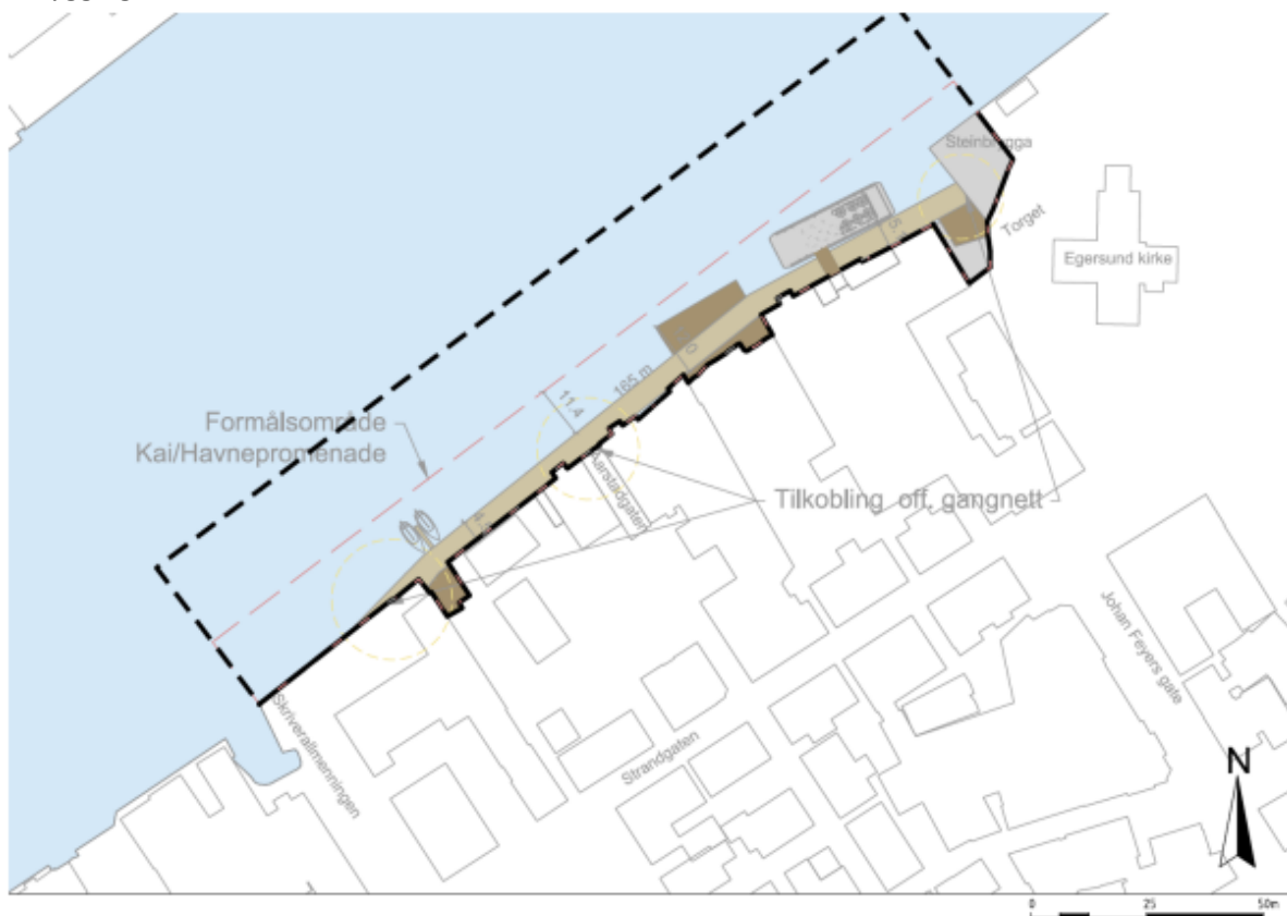
Figur 4 Illustrasjonsplan som viser hvordan en promenade/kai kan utformes inn forbi rammene av reguleringsplanen.

Illustrasjonsplan er et resultat av medvirkningsprosessen med grunneiere, kommune og plankonsulent/arkitekt for en omforent utforming av havnepromenaden. Fremstillingen i illustrasjonsplan og andre illustrasjoner av havnepromenaden er ment som en illustrert utnyttelse for utbyggingsområdet.