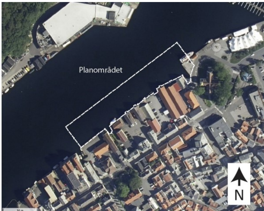
Figur 2 Flyfoto som viser eksisterende situasjon i planområdet