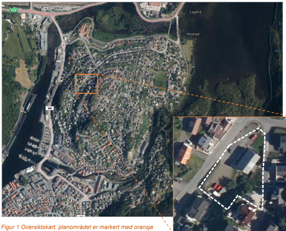
Figur 1 Oversiktskart. planområdet er markert med oransje firkant og i utsnitt nede til høyre med markert planområde.

Arealet på planområdet er på ca. 2 daa. Planavgrensningen følger i hovedsak eiendomsgrenser til gnr. 46 bnr. 6, teignr. 5.