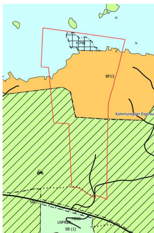
FIGUR 2: PLANOMRÅDET I KPA.