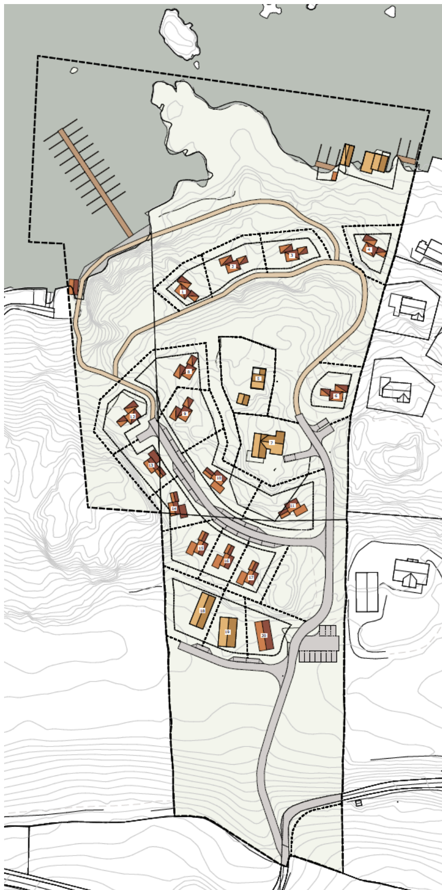
FIGUR 3: SITUASJONSPLAN.