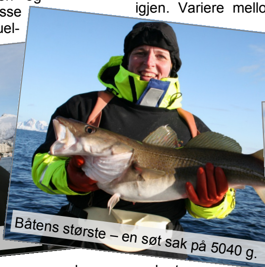
Båtens største – en søt sak på 5040 g.