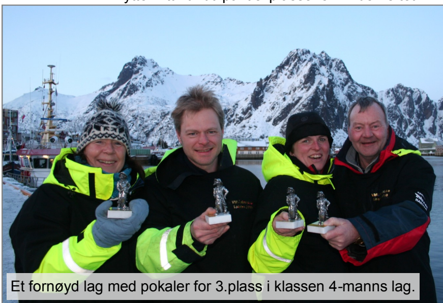
Et fornøyd lag med pokaler for 3.plass i klassen 4-manns lag.