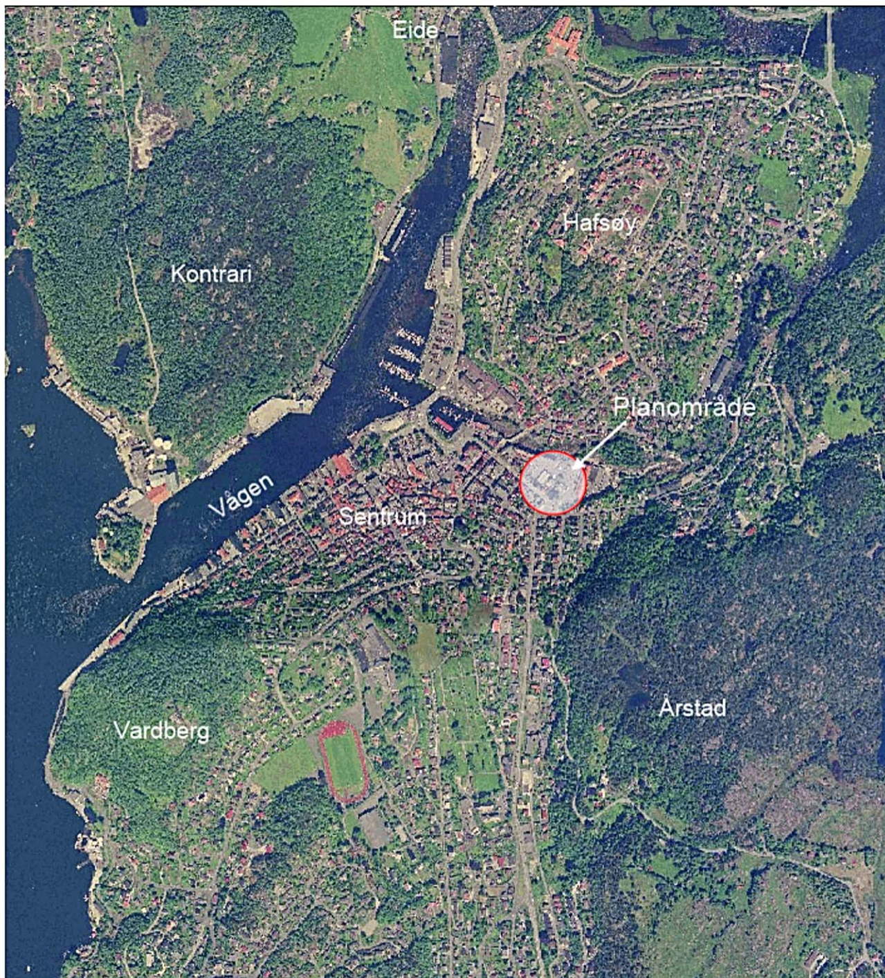
Kart fra www.egersund.kommune.no