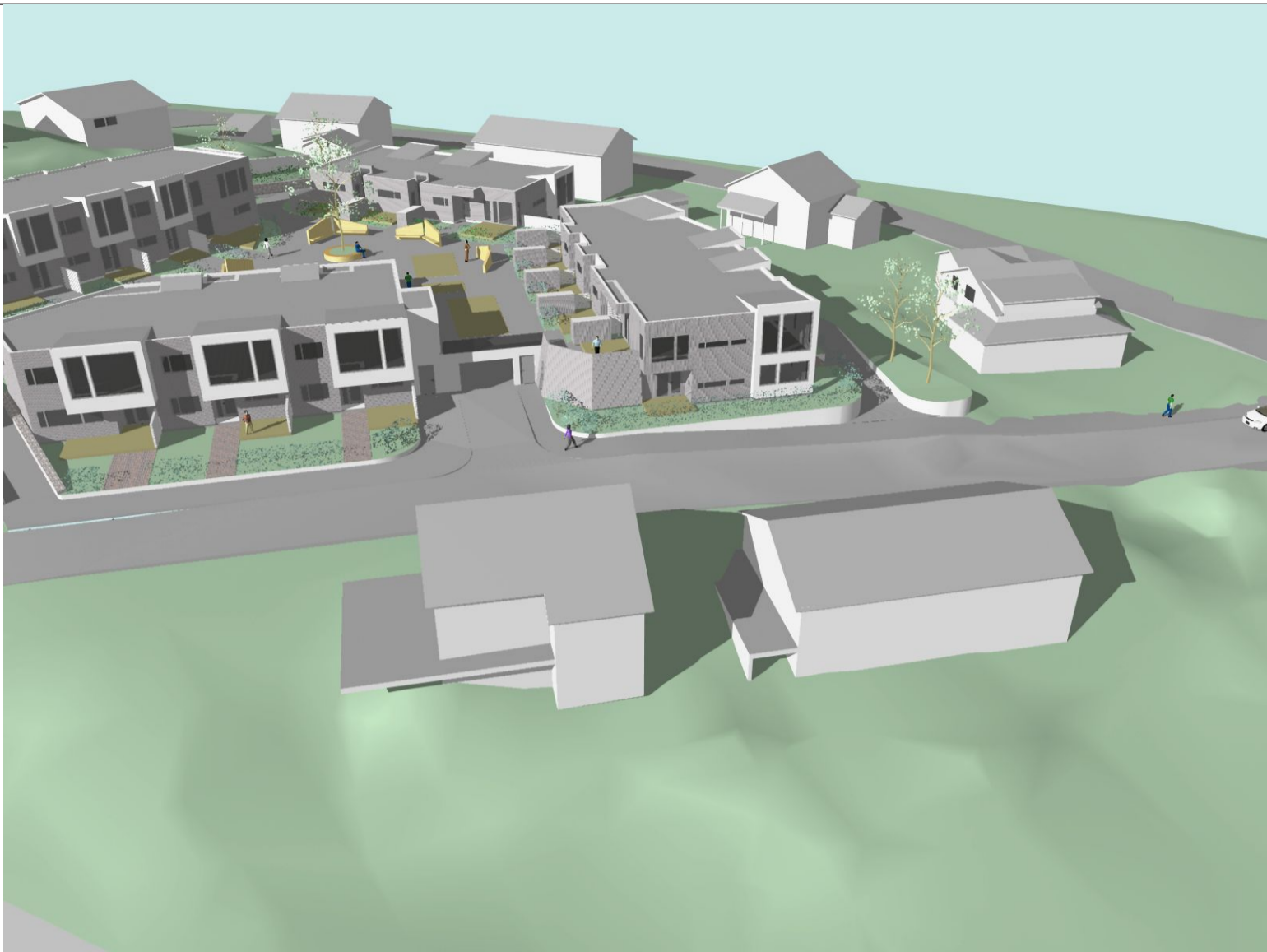
Den 21. mars kl 15:00 vil ikke det nye boligprosjektet endre solforholdene til nabotomtene Gnr. 44/Bnr. 157 og Gnr. 46/Bnr. 813.