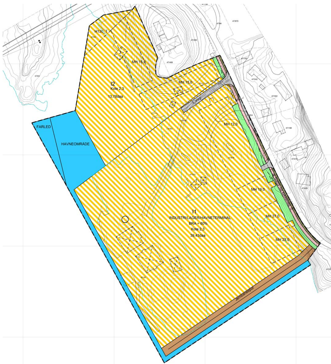
Figur 5.1. Forslag til reguleringsplan for Langholmen.

Reguleringsformålet er kombinert bebyggelse og anleggsformål, som også inkluderer havneområde i sjø med farleder, infrastruktur, grønnsstruktur og hensynssoner.