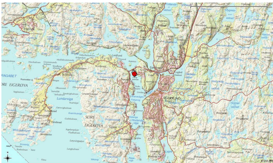
Figur 2.1. Regional lokalisering av planområdet er anvist med rød sirkel på kart over.

Planområde ligger sentralt i forhold til Egersund by, og tilgrenset industri.