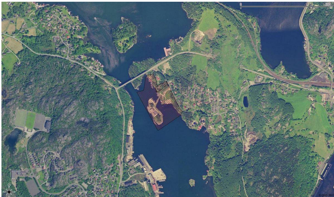
Figur 2.2. Planområdet er avgrenset med rød skravur, like sørøst for Eigerøybrua. (www.norgebilder.no).