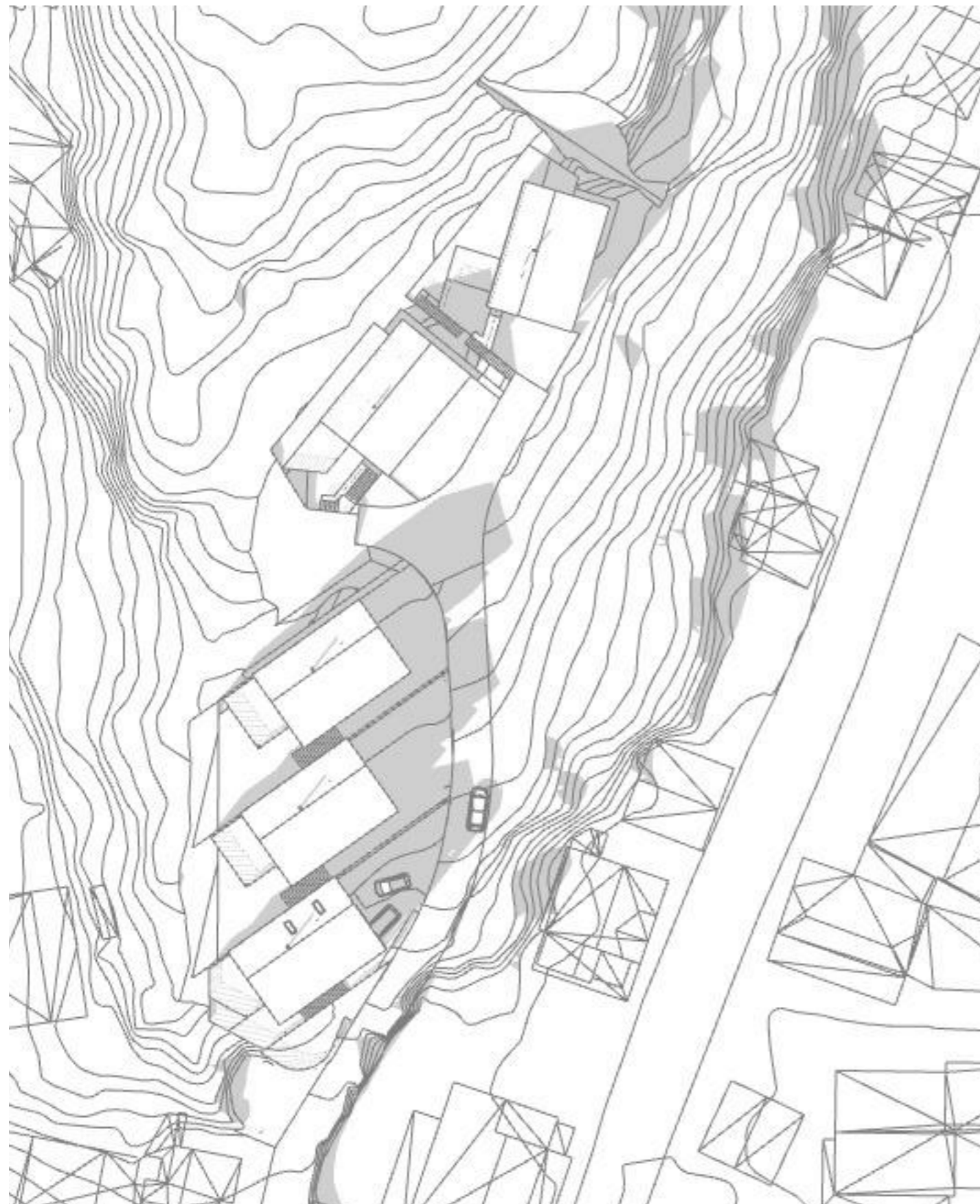
21. Mars kl 15.00