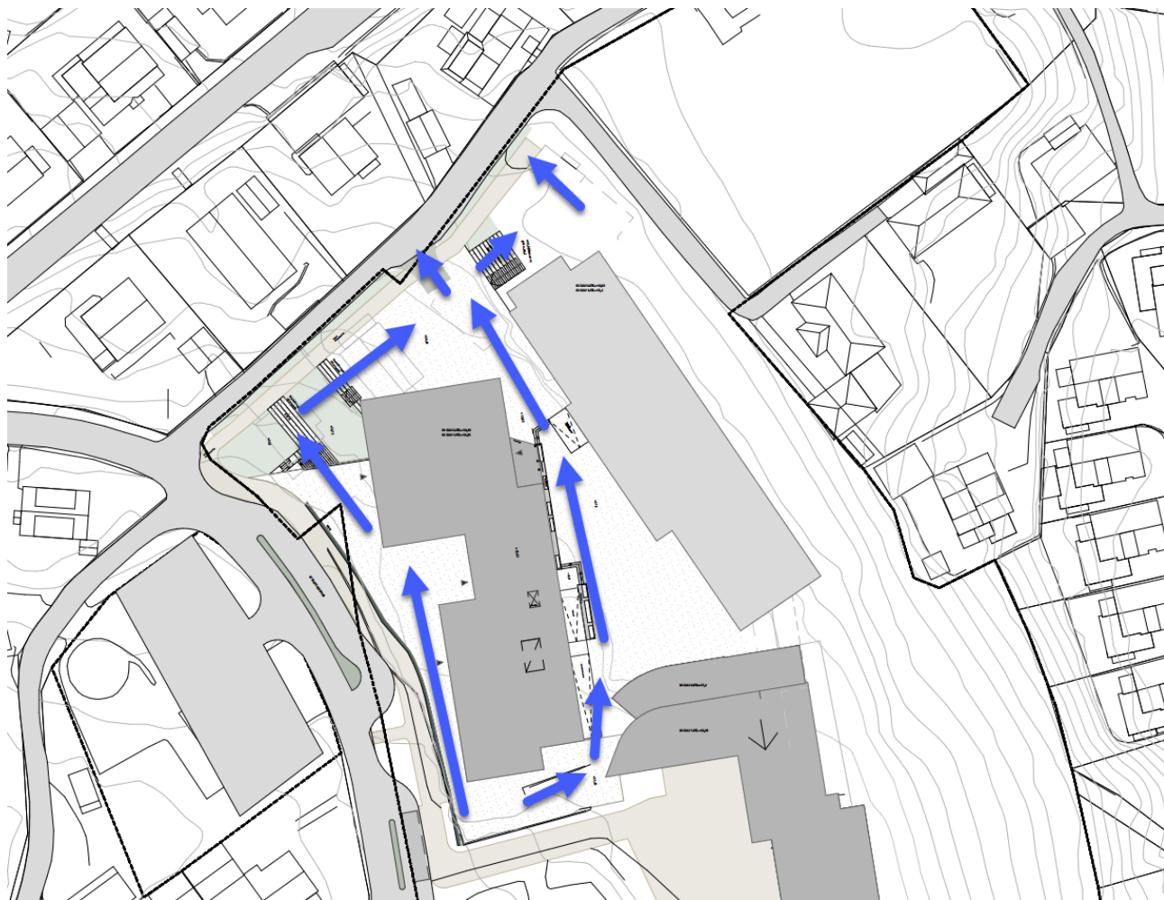
Figur 4: Flomvei med nytt ungdomsskolebygg