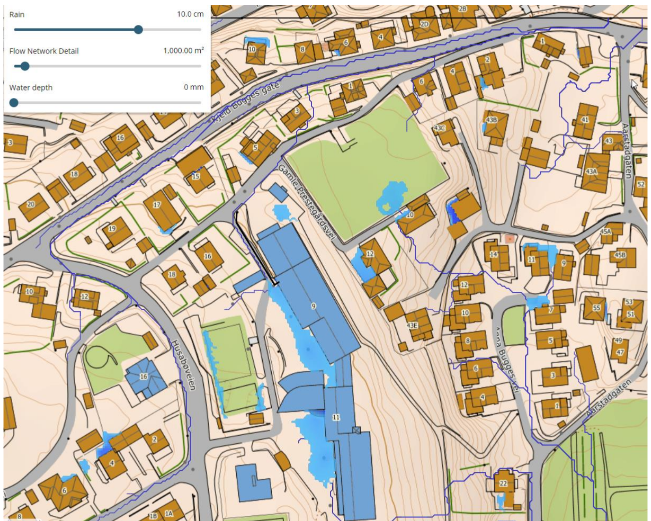
Figur 3: Utklipp fra Scalgo.com som viser eksisterende flomvei

Under er et utklipp som viser eksisterende flomveier for Husabø Ungdomsskole.