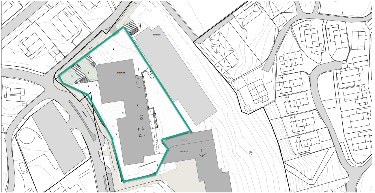
Figur1: Oversikt over området som håndteres for overvann. Området er markert i grønt

For å ivareta påslipp på 10 l/s ved dimensjonert tilrenningstid og regnintensitet er det lagt inn noen LOD-tiltak for å redusere avrenningen fra området som omfatter bygging av ny Husabø Ungdomsskole. Se figuren over som viser til området som fordrøyes.